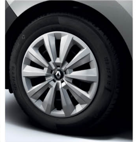
عجلات KIJARO مقاس 15 بوصة

* نظرا للتحسين المستمر ، تخضع جميع المواصفات المذكورة أعلاه للتغيير حسب التصنيع دون إشعار.