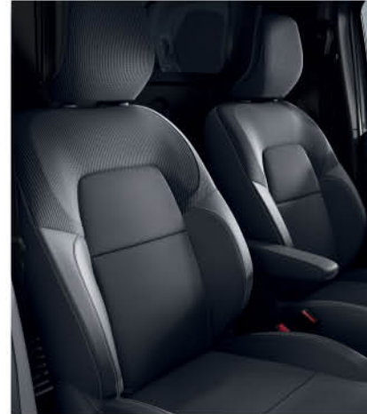
تنجيد القماش الأسود